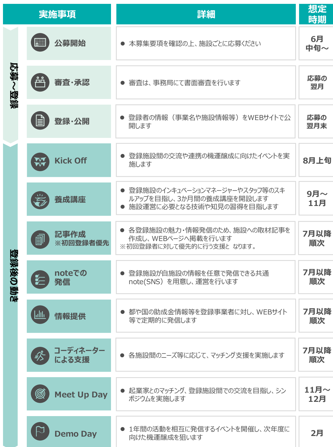
図 2 事業スケジュール