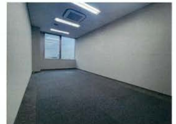
事務所スペース (窓側)