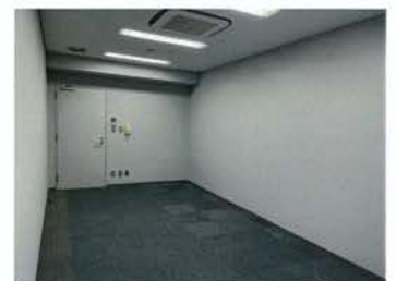
事務所スペース (扉側)