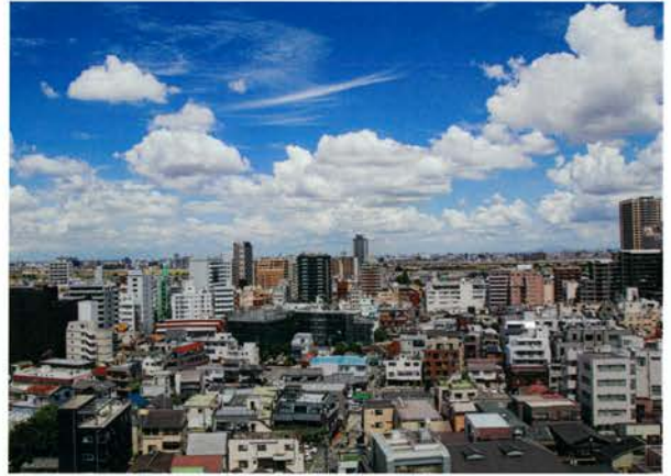
事務所からの眺望