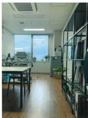
事務所スペース ※什器はイメージです